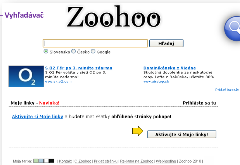
Obrázok 1 – Vyhľadávač

Katalóg – je zoznam internetových stránok zoradený podľa určitých kategórií (tém) a podkategórií (pozri obr.2). Teda k hľadanej stránke sa potrebujeme preklikať.